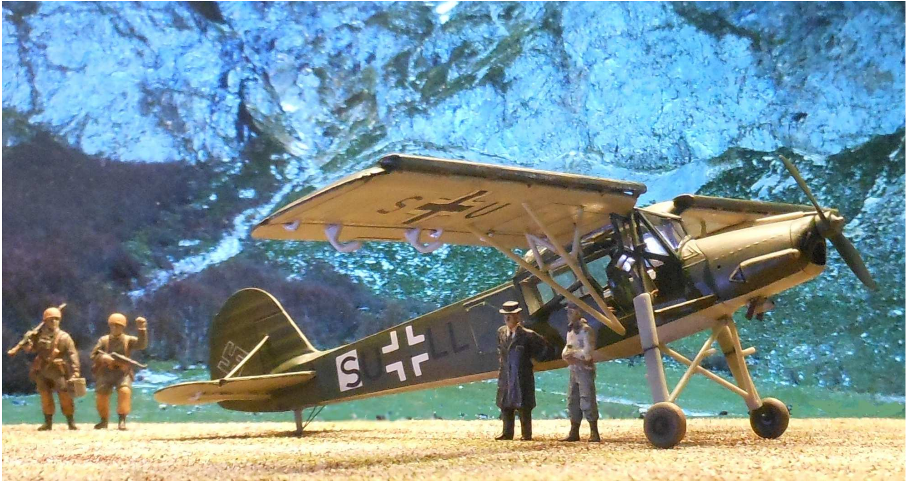
de 'Storch' van Gerlach is net geland op de Gran Sasso en staat op het punt om Mussolini en Skorzeny aan boord te nemen terwijl enige fallschirmjäger toekijken