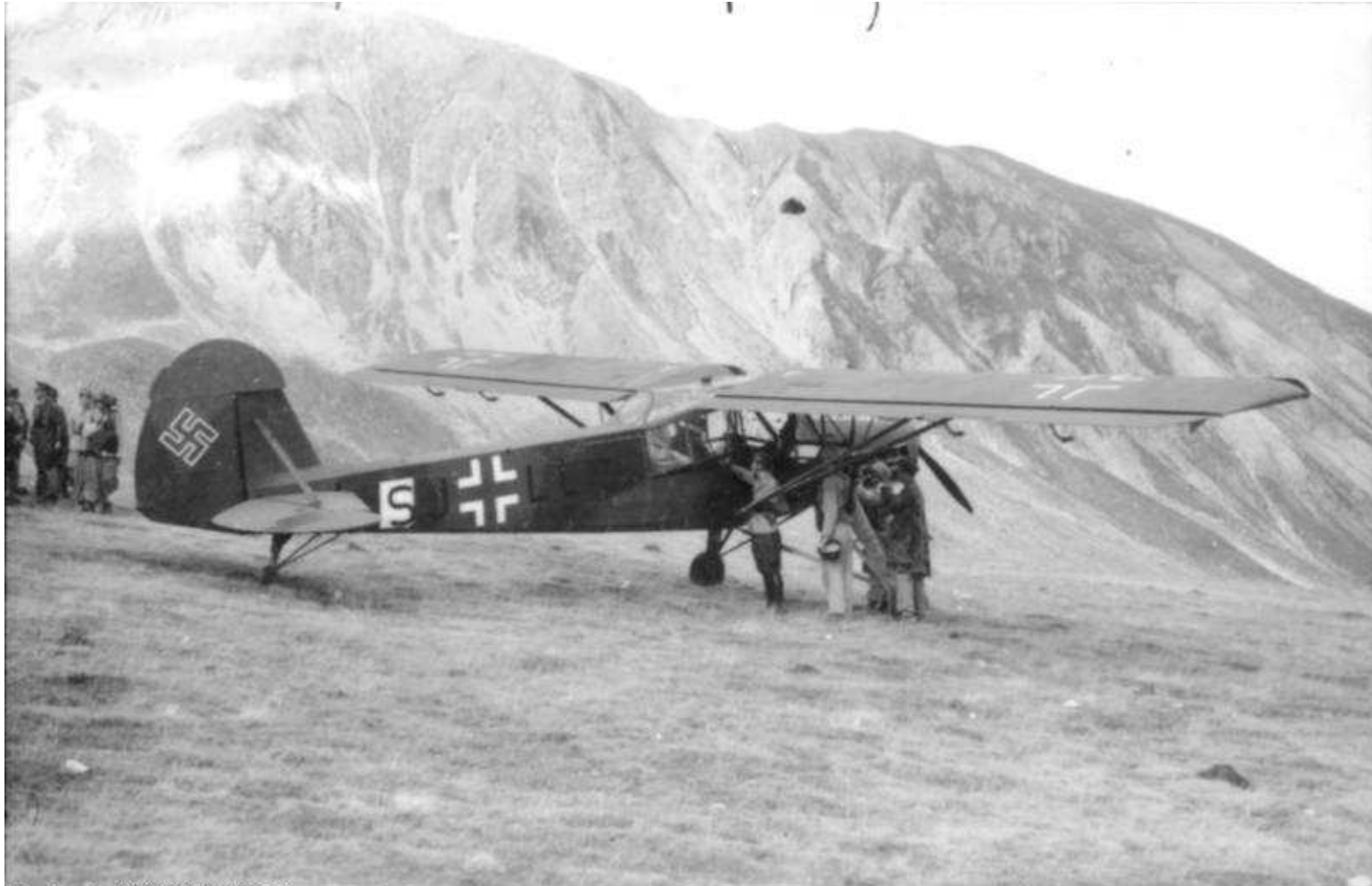
12. September 1943

Gran Sasso : Mussolini en Skorzeny zitten reeds in de 'Storch' – Gerlach wisselt nog enkele woordjes en enkele Fallschirmjäger kijken toe