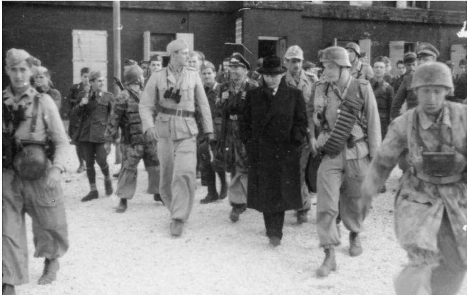
Bundesarchiv, Bild 101I-567-1503C-18 Foto: Schneiders, Toni | 12. September 1943

Mussolini is zopas bevrijd en wordt onder begeleiding naar de 'Storch' gebracht – naast hem loopt Skorzeny