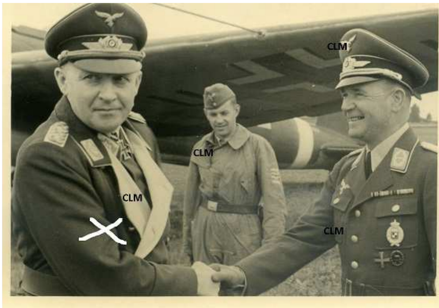
links Kurt Student en op de achtergrond zijn privépiloot Heinrich Gerlach